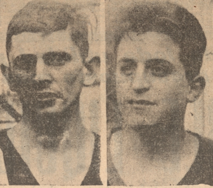
ASOCIACIÓN DE BASKETBALL DE CONCEPCION

El siguiente comentario merecen los jugadores del lance de ayer entre Cochrane y Luis Cousiño de Lota.