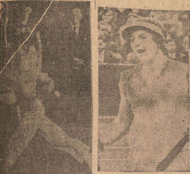
HELEN WILLS Por octava vez campeona en Wimbledon

BUDGE, EN LOS HOMBRES, Y HELEN WILLS ENTRE LAS DAMAS