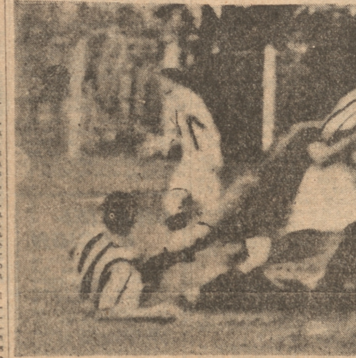
La pelota ha salido fuera de la cancha. Ha pasado ya el peligro ante la valla de los lotinos. Pero en la cancha hay jugadores en acción y vemos a cinco en actitudes de juego. Un delantero verde al caer, sujeta a un colega lotino. Al fondo se ve a Vial uno de los mejores jugadores del Luis Cousiño.