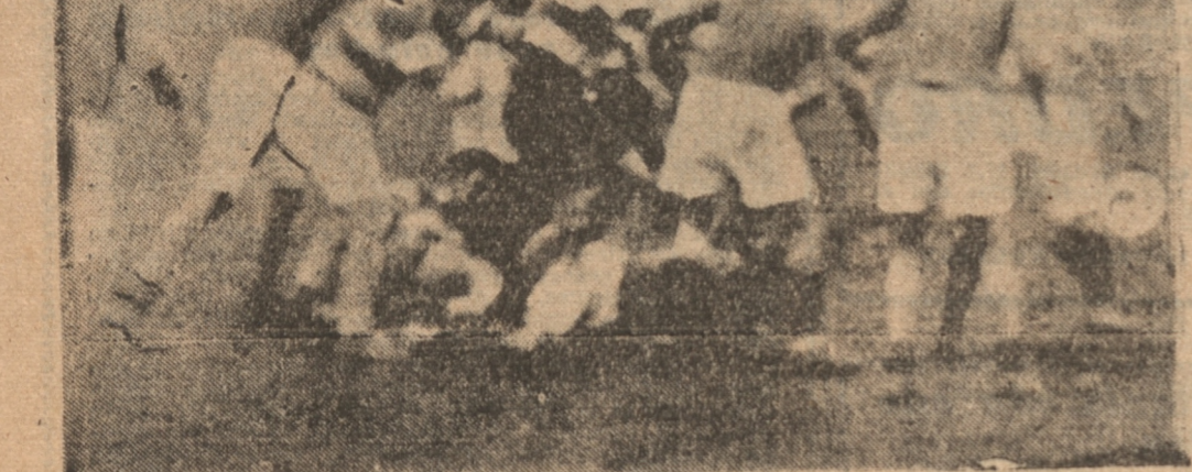
NUESTRO FOTOGRAFO Bernales tomó ayer en el Estadio de Puchacay esta interesante fotografía del partido entre el cuadro de honor de la Y. M. C. A. de Santiago con el Lord Cochrane de Concepción.