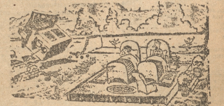
CASAS BARATAS EL.— Hemos hecho muy mal en atar al perro al pie de la entrada.