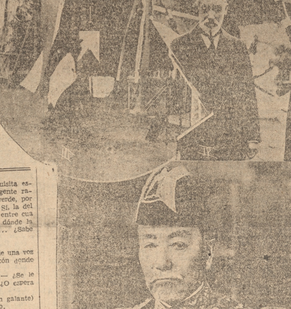
1) El almirante Heihachiro Togo, acompañando al Emperador del Japón durante unas recientes maniobras de la Armada japonesa. — 2) El paso del armón que conducía el cadáver del almirante Togo por las calles de Tokio, en las que se alineaba una emocionada multitud. — 3) Minocuo Togo, hijo y heredero del almirante fallecido, orando a la puerta de la cámara en que se hallaba depositado el cadáver de su padre. — 4) El general Nogi (a la derecha), otra de las glorias japonesas de la guerra con Rusia, Nogi se abrió el vientre al morir el Emperador Muji, en 1912. — 5) Uno de los últimos retratos del almirante Togo.