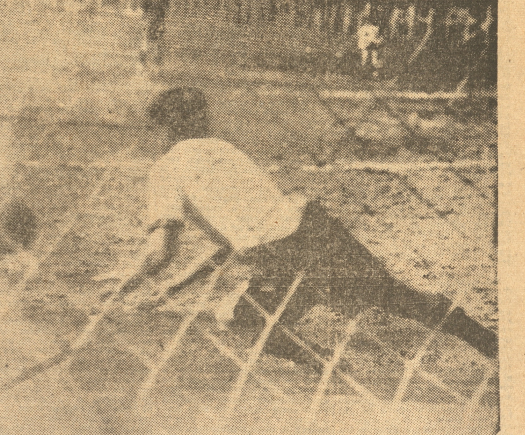
EL PELIGROSO winger derecho del Carlos Cousiño de Lota, Vázquez, se había filtrado seriamente en busca de la valla del Victoria de Chile y