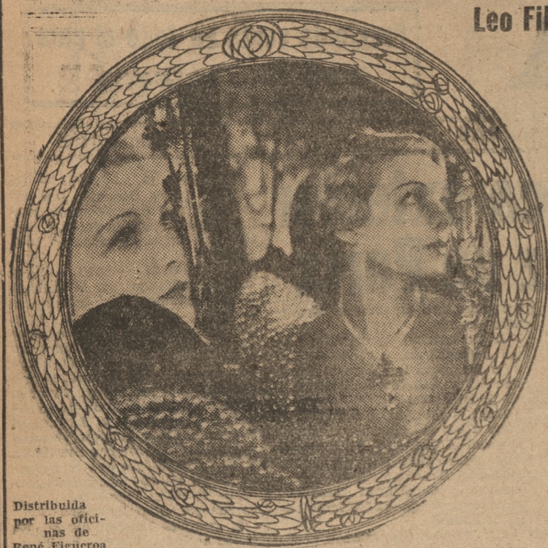
Distribuida por las oficinas de René Figueroa

Los amores de la Reina Carlina de Dinamarca con el Dr. Struense, amores que culminaron con la grandeza de la patria, y el patíbulo para el héroe