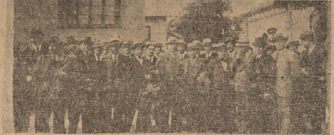
GRUPO DE MEDICOS QUE ARRIBARON POR EL NOCTURNO, ACOMPAÑADOS DE SUS COLEGAS QUE FUERON A RECIERLOS