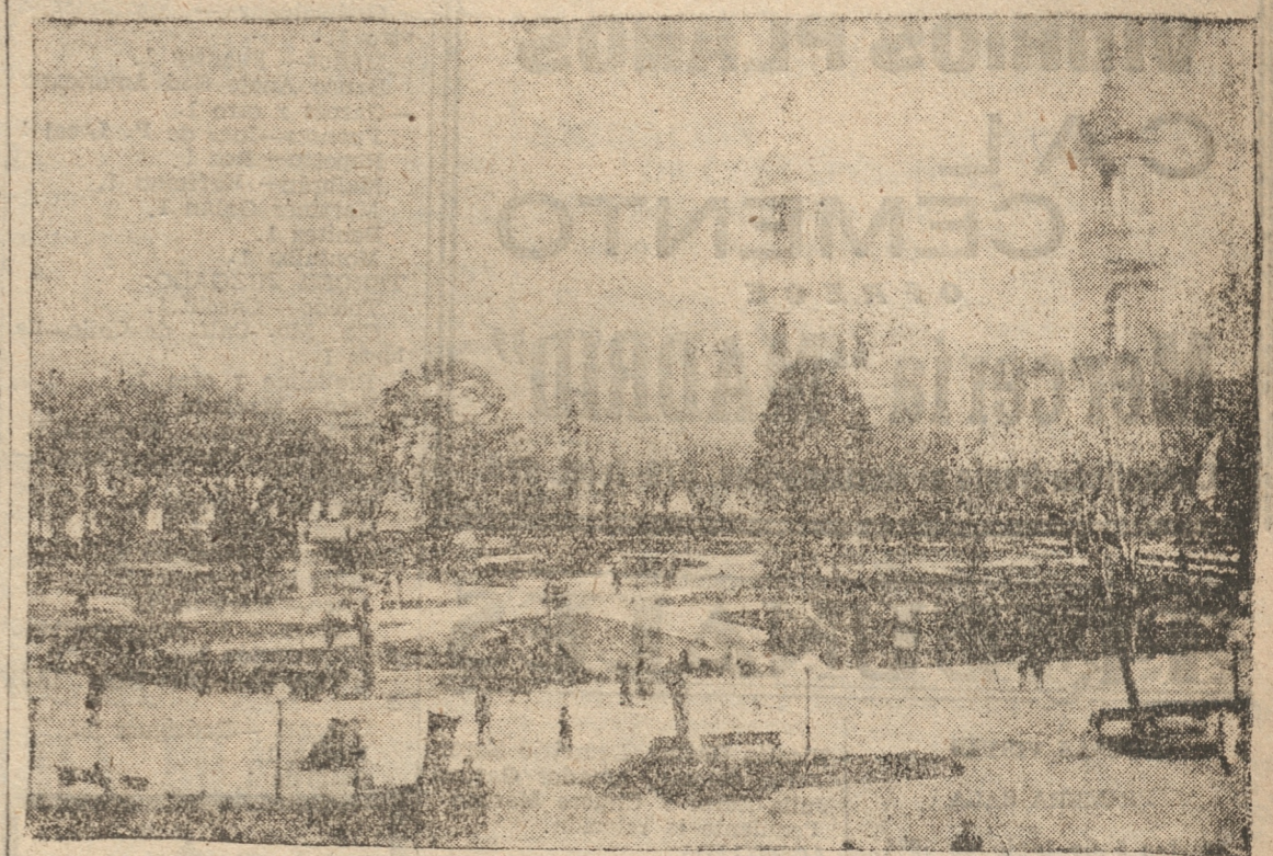
La presente ilustración da una idea acerca de cómo ha quedado nuestro paseo principal, después de haber sido retrazados los troncos de los tilos que derribó el tornado.

Puede observarse el cambio fundamental producido en el aspecto de la Plaza Independencia, despojada de sus mejores adornos y de la impresión desolada que ahora da.