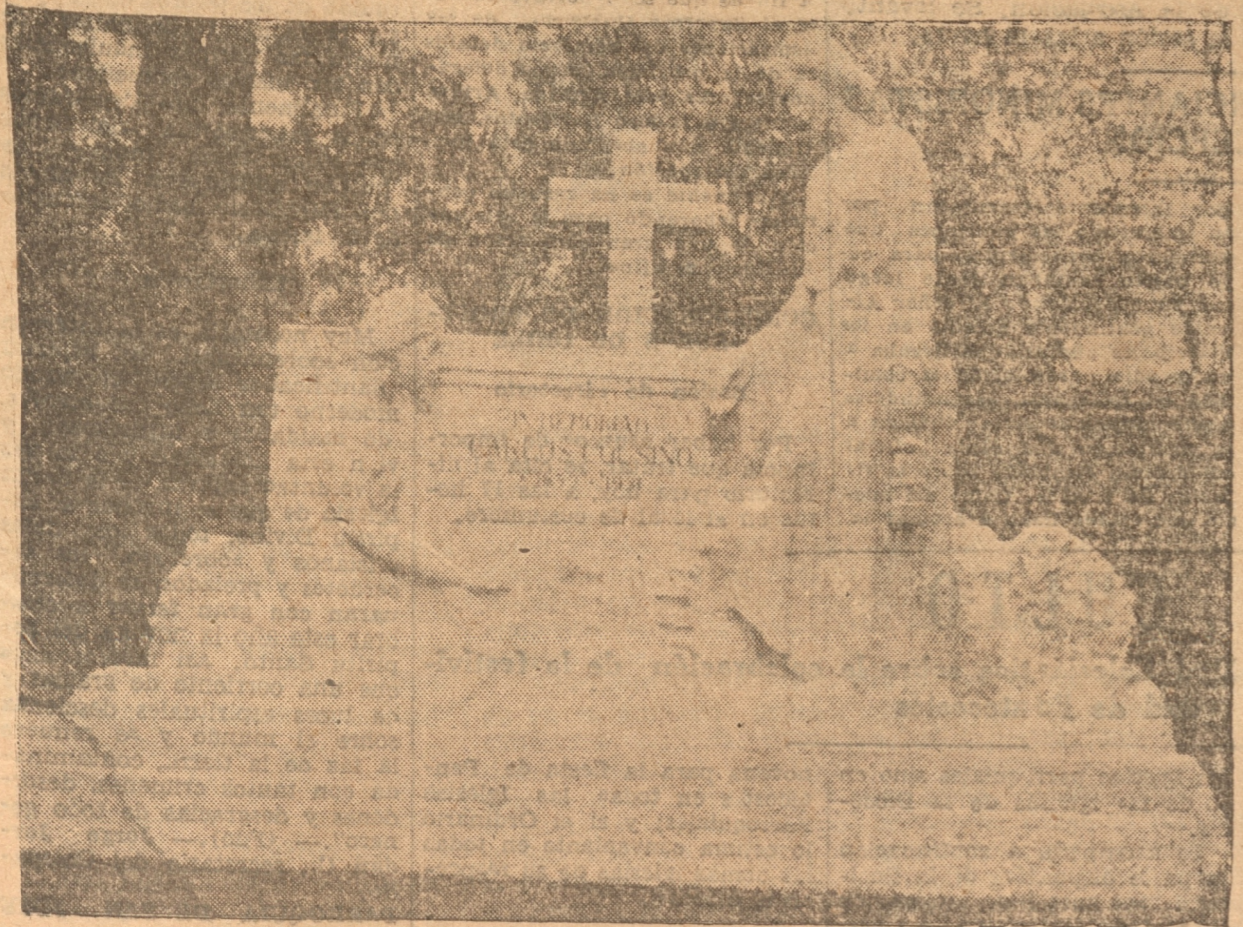
LA TUMBA DE DON CARLOS COUSINO

Se efectuó ayer en Lota Alto con participación de delegaciones de todas las instituciones sociales de Lota y escuelas de la localidad