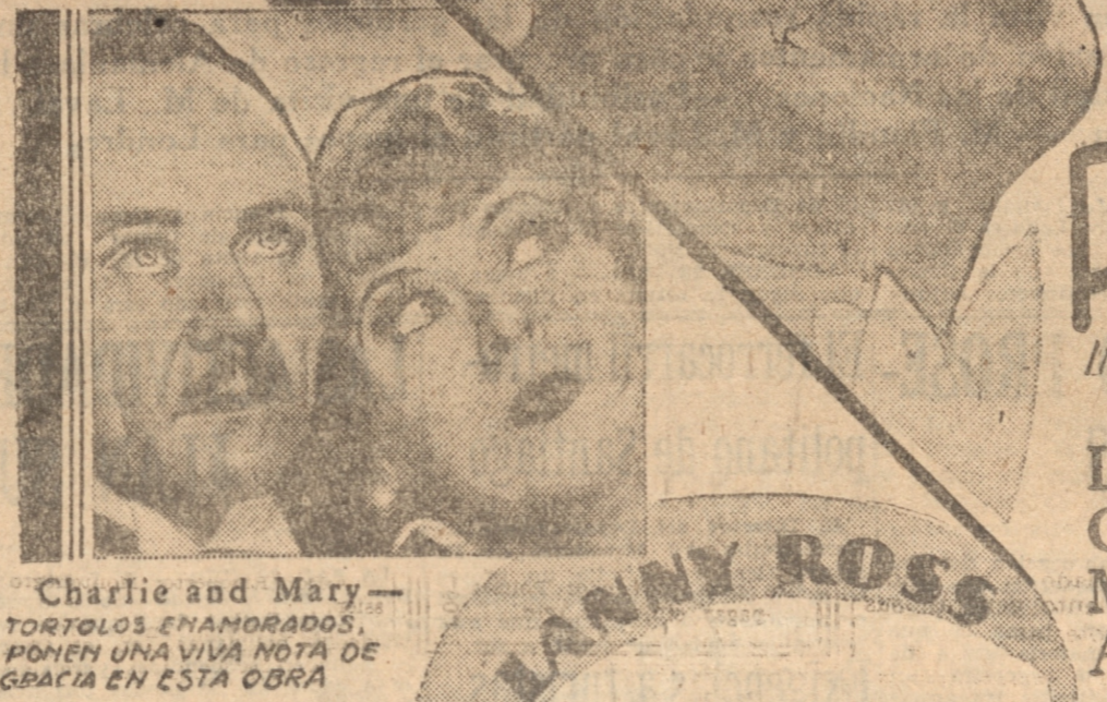
Charlie and Mary — TORTOLOS ENAMORADOS, PONEN UNA VIVA NOTA DE GRACIA EN ESTA OBRA

LANNY ROSS CHARLIE RUGGLES MARY BOLAND ANN SOTHERN