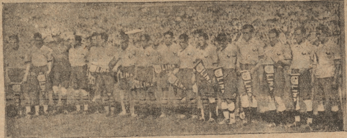
EL EQUIPO CHILENO QUE ACTUO EN EL CAMPEONATO DE LIMA

Nada claro nos ha dicho el cable hasta ayer. Ya vendrán crónicas postales y otros comentarios que nos darán la luz en este asunto.