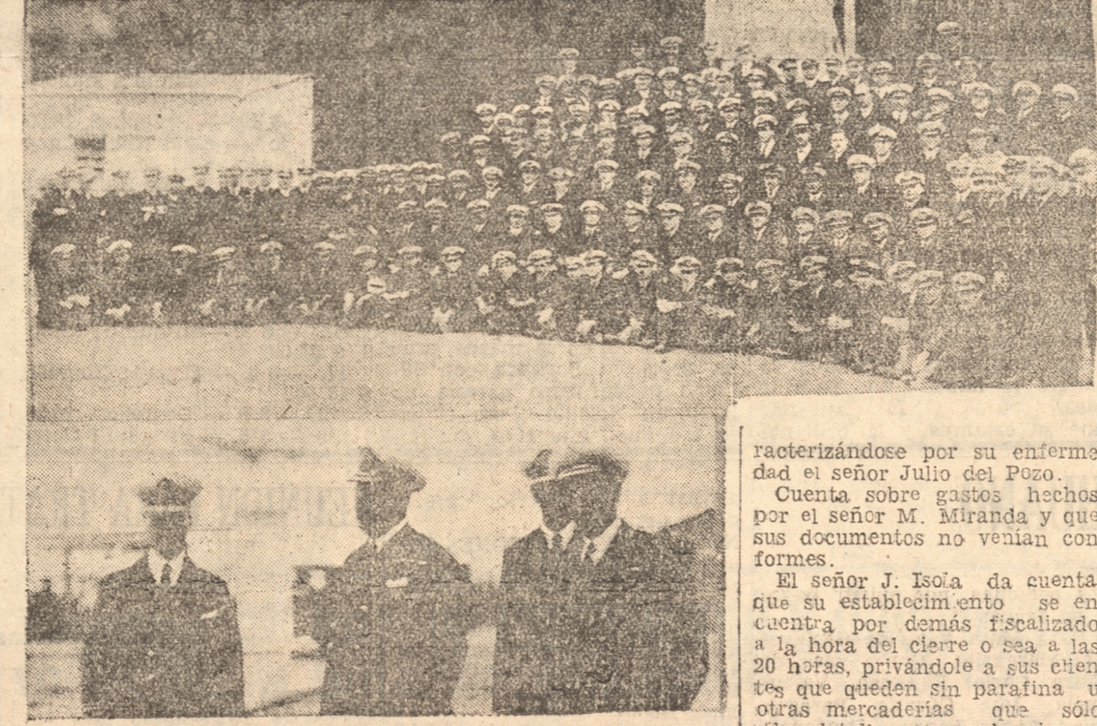
Grupo general de asistentes al almuerzo ofrecido en la Escuela de Torpedos en honor del contralmirante Rogers. — Durante una de las visitas que hizo.

Caupolicán 233 Para ocuparse de estos importantes problemas y tomar acuerdos decisivos, el gremio de panaderos convocó a una asamblea pública para hoy a las 18 horas, en Caupolicán 233, invítándose a esta reunión a los sindicatos de obreros marítimos y de laneros, a la Federación Obrera de Chile, a la Unión Sindical de ex y obreros de los Arsenales de Marina, a todas las instituciones gremiales y mutualistas, al Partido Democrata, a la Asamblea Radical, al Partido Comunista y todas las personas que tengan interés en evitar que se produzca el hambre al pueblo y especulación con los artículos alimenticios.