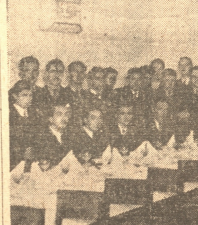
ASPECTO DE LOS QUE CONCURRIERON A LA COMIDA DE ANOCHES EN EL RESTAURANTE "NURIA"

recorrido del mobiliario; visita a las alumnas de los sextos años al norte; y terminación del edificio de la calle Rengo.