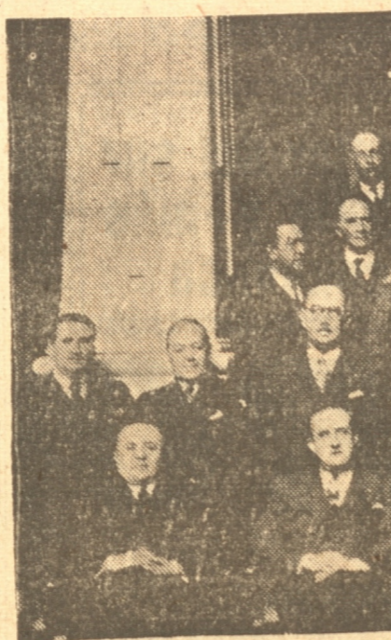
OFRECIDO POR LA UNIVERSIDAD EN EL CLUB CONCEPCION ASISTENTES AL ALMUERZO

Se retiró muy bien impresionado de la labor que desarrolla este Liceo a pesar de las deficiencias materiales con que tropieza.