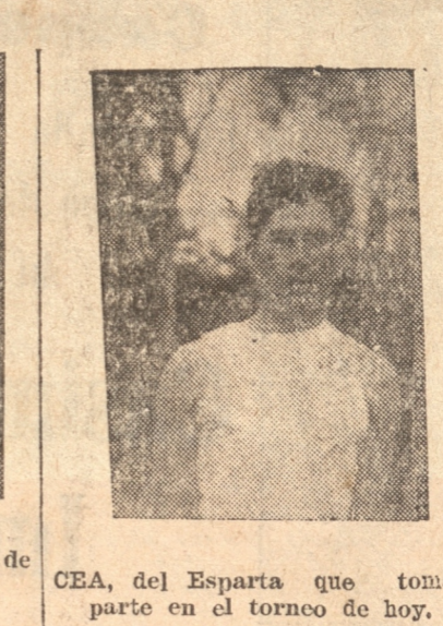
CEA, del Esparta que tomará parte en el torneo de hoy.