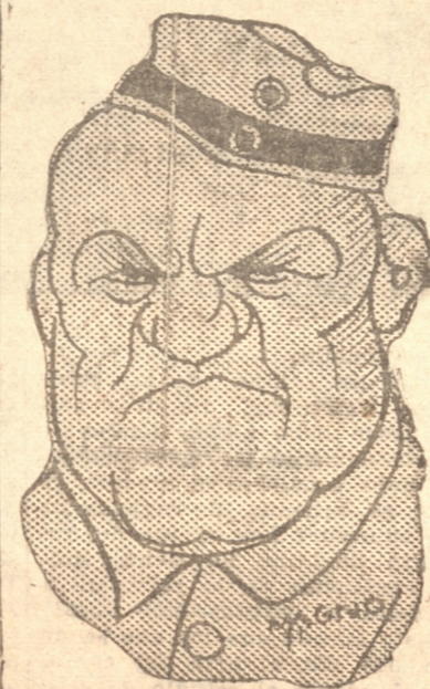
Wolheim, admirable actor que aparece en Sin Novedad en el Frente (Como lo ve Mora).

La empresa del Metropolitan reclamó por la vía diplomática al entonces presidente del Consejo, general Primo de Rivera, contestó telegráficamente que el español estaba libre y de sus compromisos militares y podía salir de España con entera libertad. Surgió la demanda, a la que siguió el pleito. La defensa de Fleta fué bien sencilla: el jefe del Gobierno podría considerarle libre de las obligaciones militares, pero el capitán general de la región, que es el que tiene que conceder las licencias, no. Por no concederla se perdió el pasaje tomado por Fleta en el transatlántico Paris, para marchar a Nueva York según documentación que obra en autos.