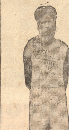
ECHEVERRIA, el notable corredor internacional del Rangers que participará hoy.

A los clubes que no han cumplido con el envío de formularios de inscripción por atleta, no se les permitirá tomar parte en el torneo de todo competidor, fuera de otras sanciones que se tomarán en su contra.