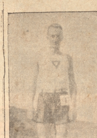
SAHR, atleta del Aleman que actuará hoy.