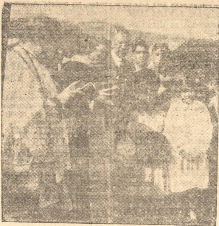
EL ILMO., SEÑOR OBISPO DURANTE LA BENDICION

Poco después se dio comienzo a la ceremonia de entrega y bendición del cementerio ante numerosas personas que habían ido desde Chiguayante y La