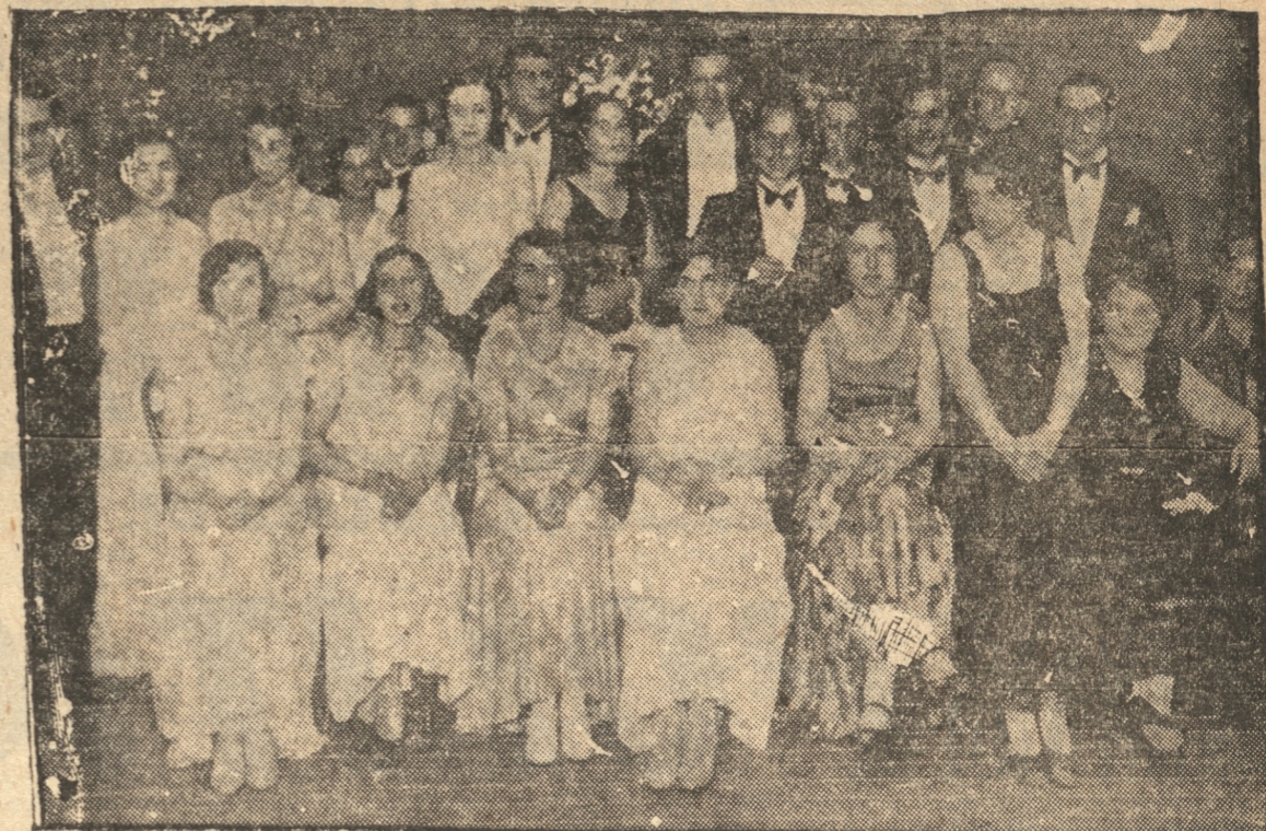
Grupo de asistentes al baile efectuado anteanoche en los salones del Club Inglés con motivo del Armistice Day

La sola intención oculta del crimen, es ya el crimen mismo.