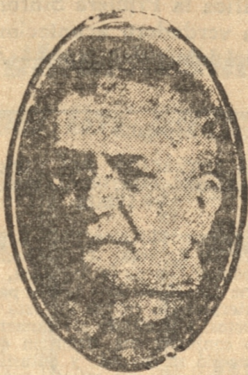
Señor LUIS IZQUIERDO, Ministro de Hacienda

—He visitado las oficinas de la Comisión agregó el señor Izquierdo, y he podido darme cuenta personalmente de la enorme labor