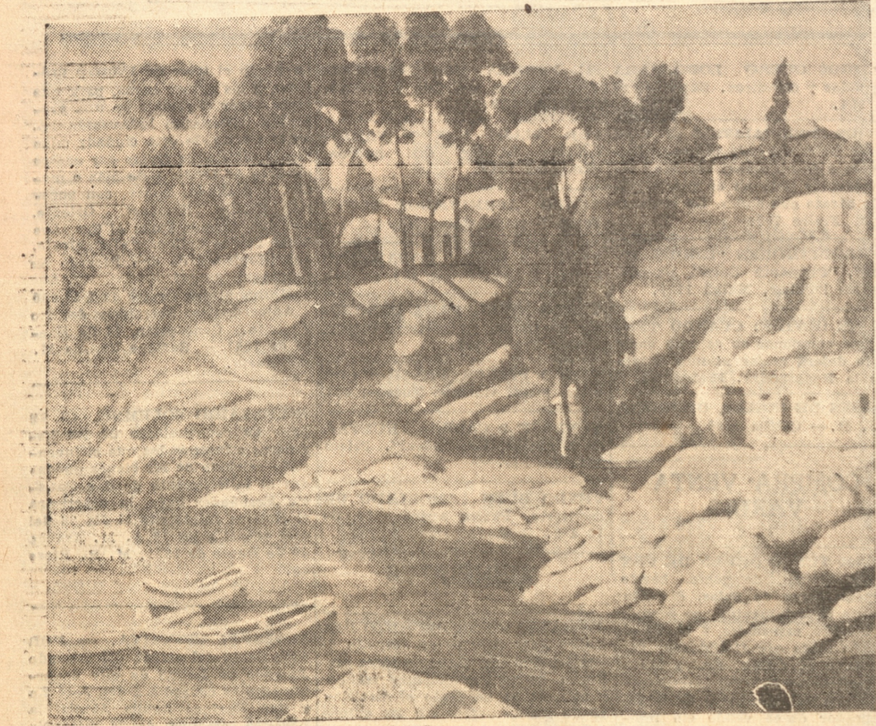
Un hermoso paisaje de Zapallar.—(Cuadro del señor Vidor)

Desde que se hizo cargo del Museo ha desplegado una labor activa con el objeto de dejarlo en las mejores condiciones posibles; ha incrementado las obras de valor que todo establecimiento de esta naturaleza debe poseer y seleccio-