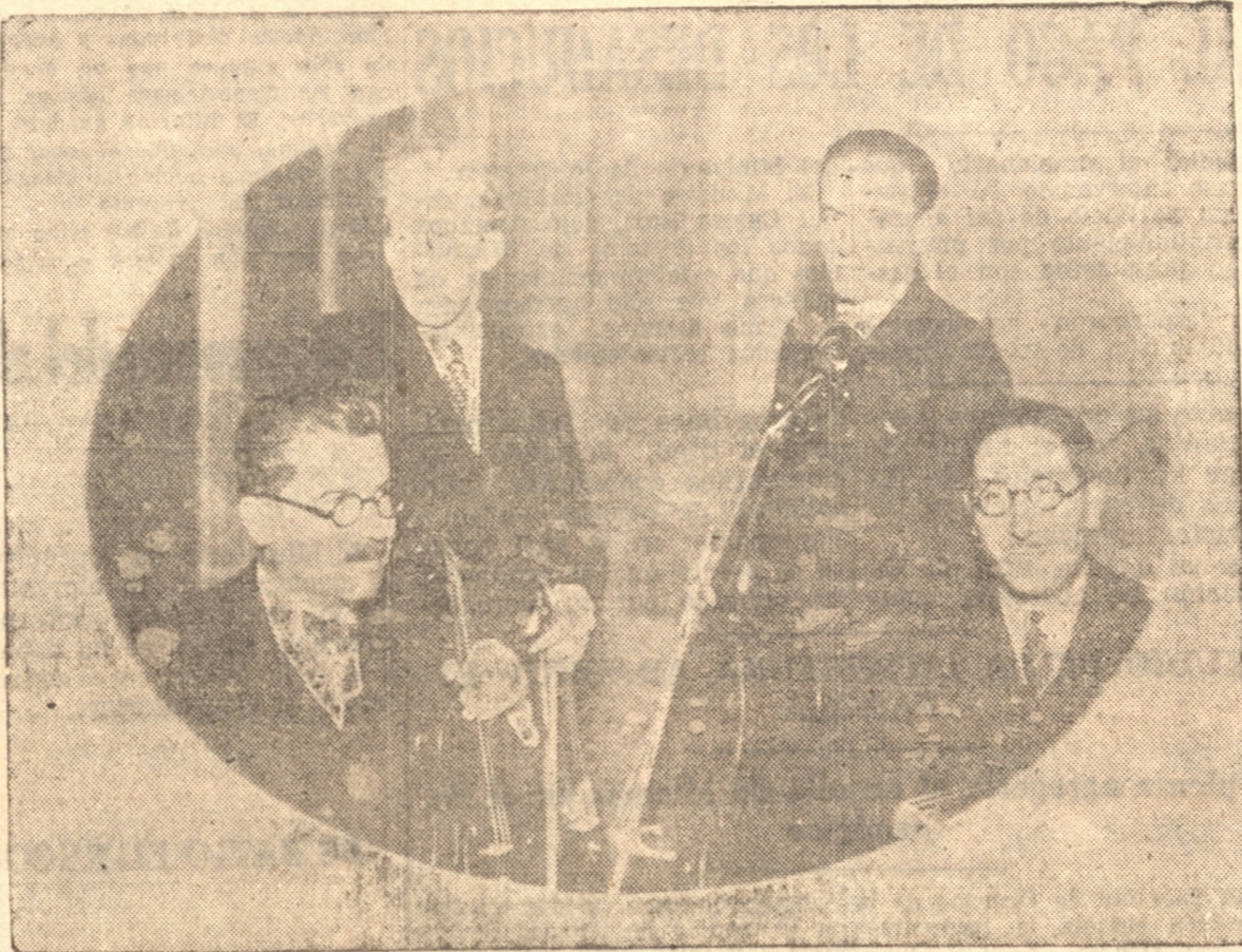
LOS COMPONENTES DEL CUARTETO DEL CONSERVATORIO. QUE NOS OFRECIERON AYER UN BRILLANTE CONCIERTO

Los tres conciertos que ejecutó el conjunto sirvieron para apreciar la armonía y al comprensión de sus componentes, que, en verdad forman un conjunto que puede rivalizar con los mejores de su especie que han visitado nuestro país. Con razón el público aplaudió cariñosamente cada uno de los números, aplausos que se repitieron larga y entusiasta mente al final del admirable concierto que dejará, sin duda alguna, los más gratos recuerdos en el ánimo de todos los que tuvieron la dicha de asistir a él.