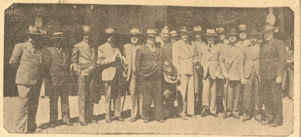
Los delegados hípicos santiaguinos, a su llegada a la estación central.