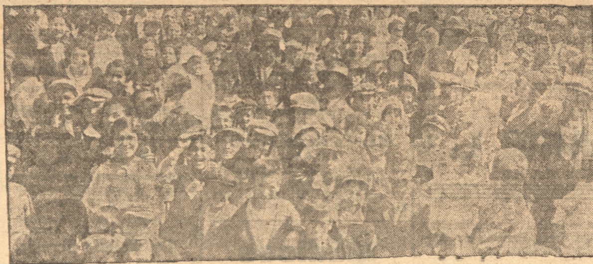
UN GRUPO DE NIÑOS CON SUS PADRES EN LA ALAMEDA

Genuino producto para el cuidado del cutir