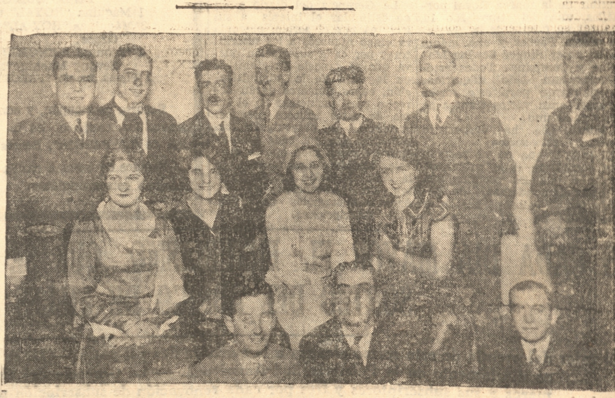
GRUPO DE AFICIONADOS QUE PARTICIPARON EN LA COMEDIA