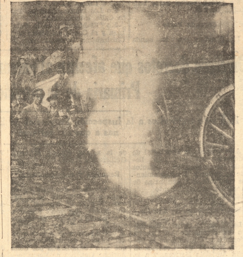
FORMA EN QUE SE PRODUJO EL DESCARRILAMIENTO

El tren de pasajeros N.º 5 que hace la carrera entre Talca y Talcahuano, y que debe llegar a esta ciudad a las 16.10 horas, hubo de detenerse ayer en el paradero denominado Agua del Obispo, por haber obstruido la vía un tren lastrero cuya locomotora se descarriló al entrar en agujas en el mencionado paradero. El accidente, según pudimos informarnos en el lugar mismo en que ocurrió, se debió a un cambio mal efectuado por lo que la locomotora y tender se salieron de los rieles, recorriendo unos veinte metros fuera de la vía. Afortunadamente el maquinista pudo evitar el volcamiento de la máquina, lo que hubiera tenido consecuencias más graves.