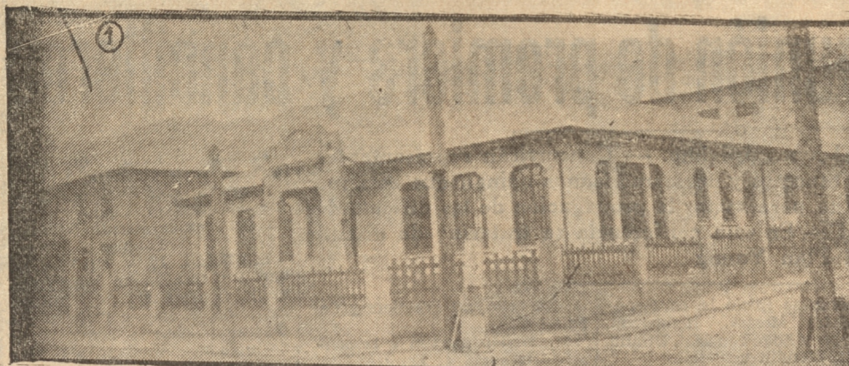
Una ligera visita a la población