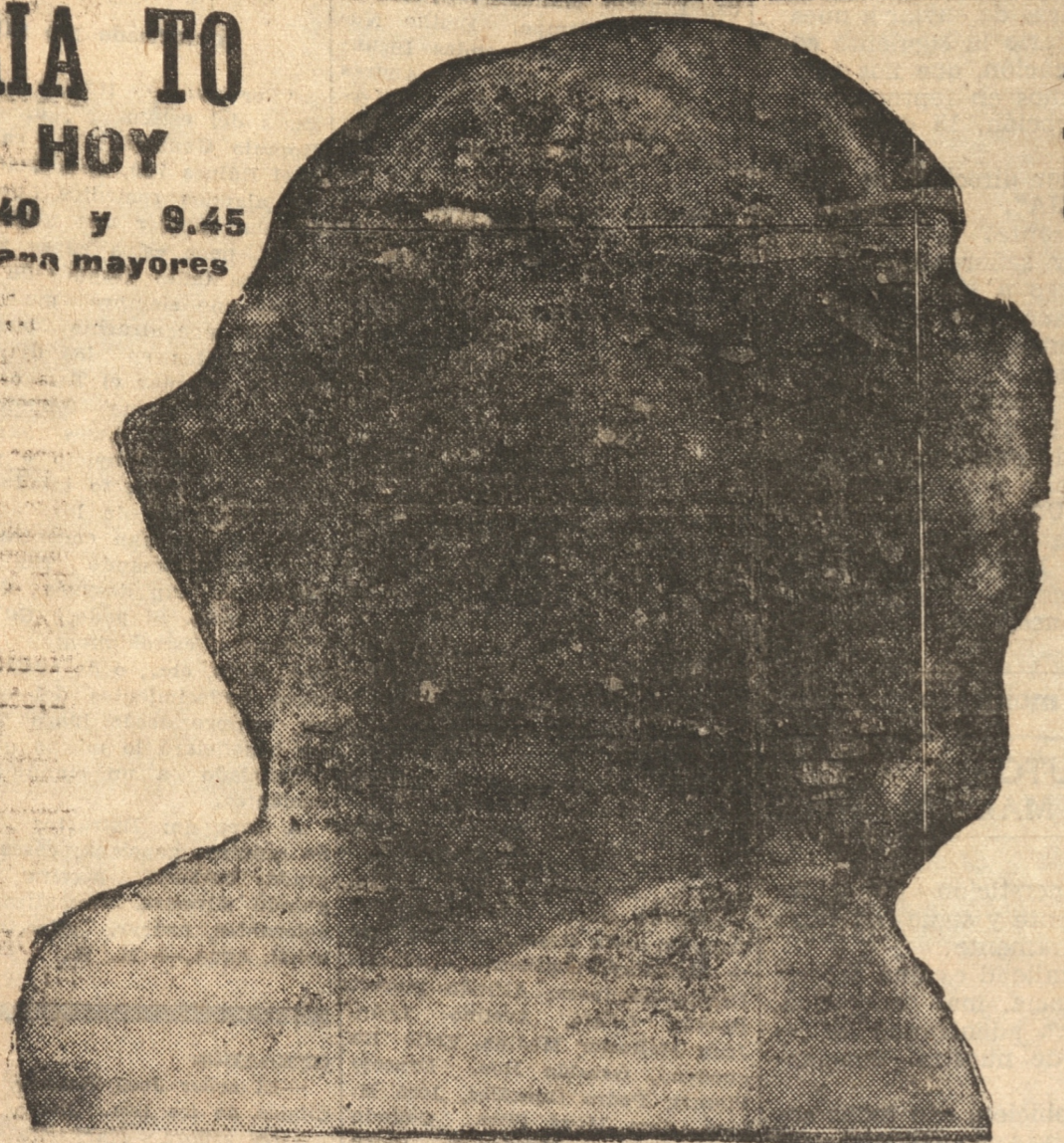
Aunque los demás me ofrezcan joyas, fortunas, honores y placeres. Sólo te quiero a ti, y MIO SERAS.

Estreno que muestra un apasionante y original conflicto, toda vida, inquietud y verdad, y que une a dos cumbres de la pantalla sonora. FOX SUPER JEANETTE MAC DONALD