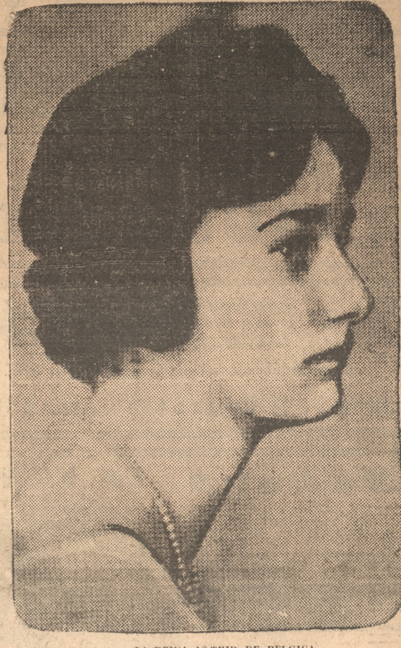
LA REINA ASTRID DE BELGICA