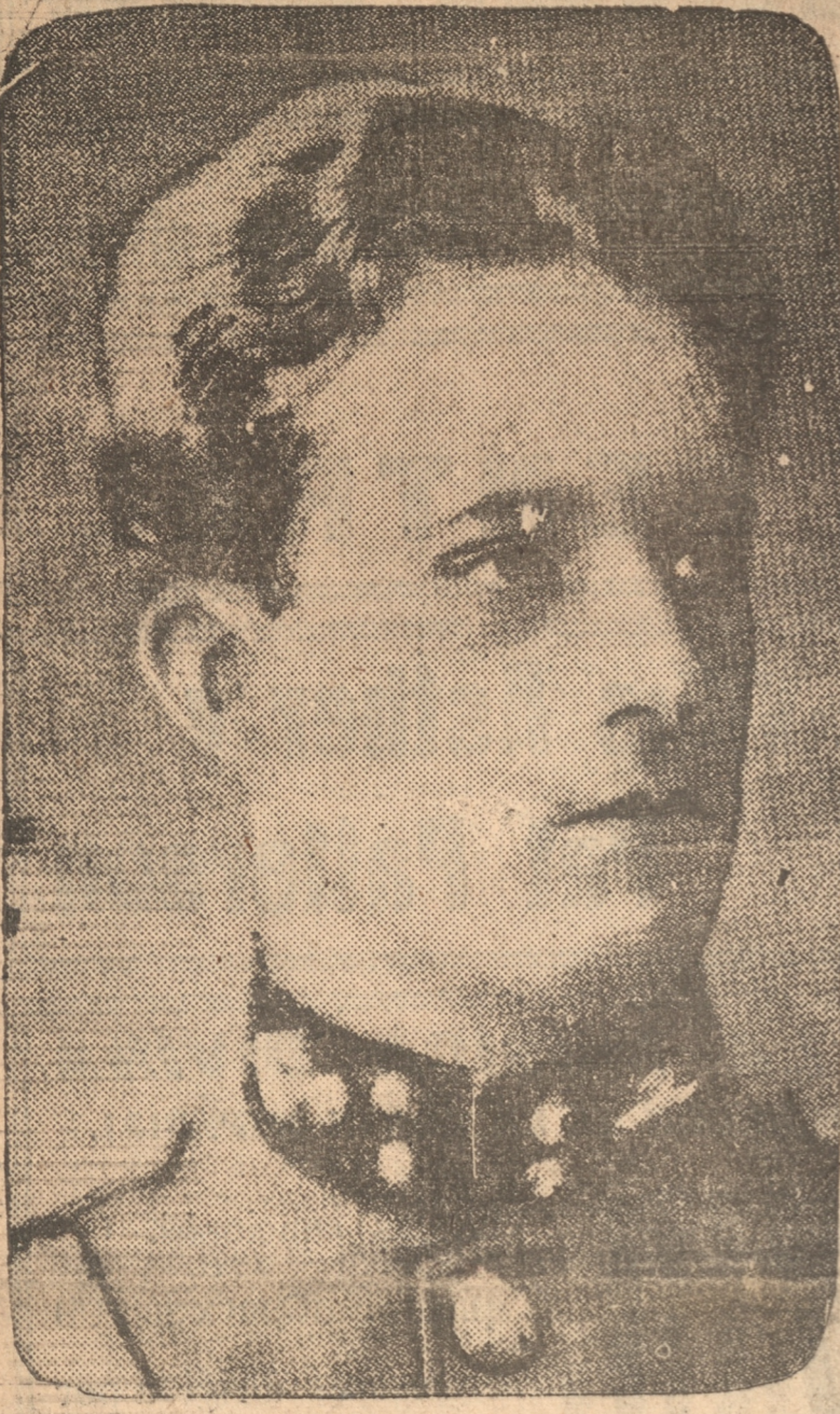
S. M. EL REY LEOPOLDO III DE BELGICA