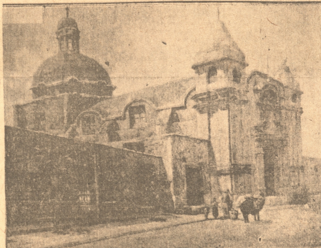
BEATERIO DEL PATROCINI O. LIMA — PERU — Una de las obras que figuró en la exposición de Zabala, en Ritz Hotel

CONSTITUYO TODO un EXITO. — FUE muy VISITADA por el PUBLICO