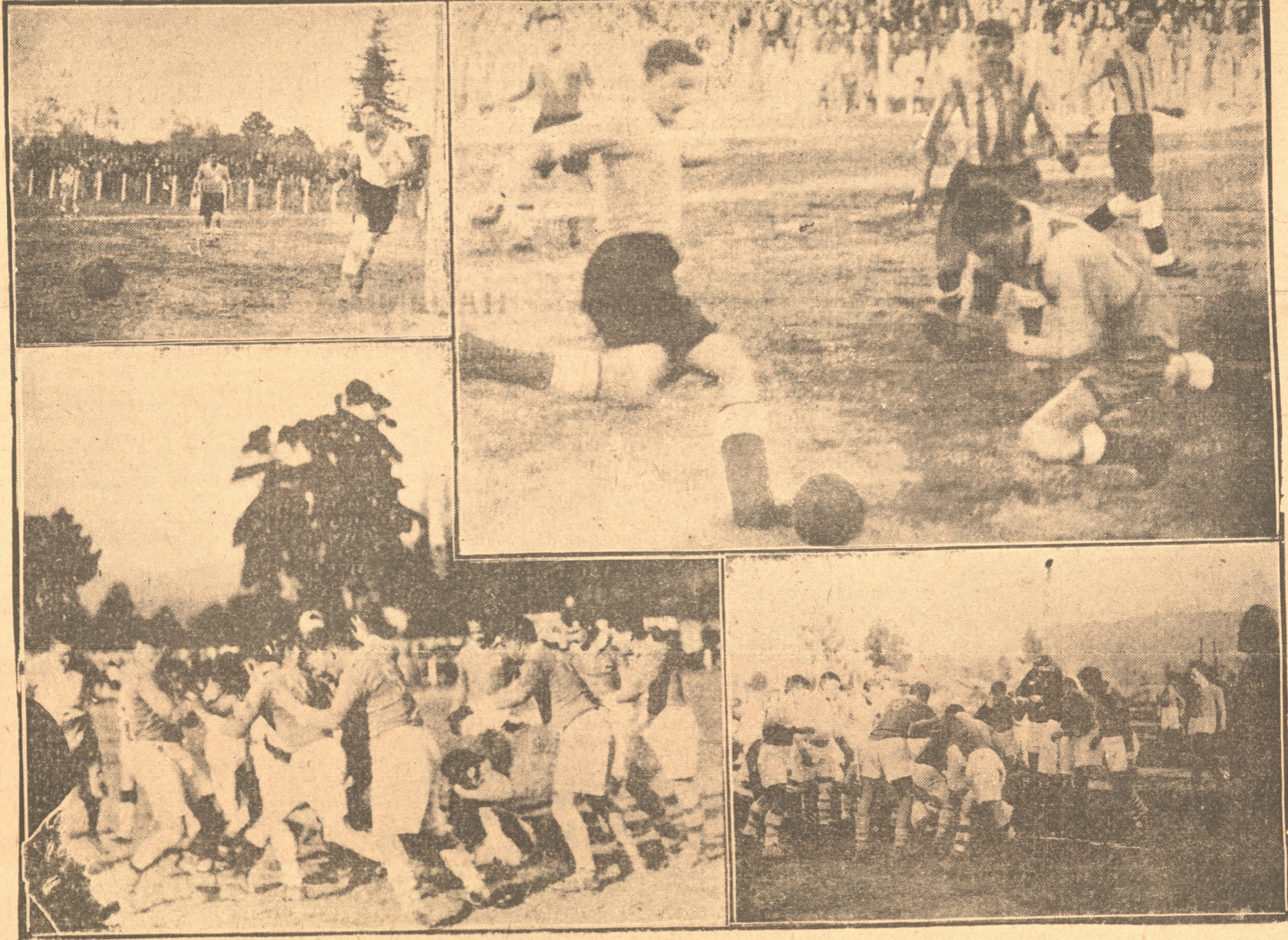
LOS DEPORTES AYER fueron realmente activos. En ellos por medio de estas fotos vemos a dos incidentes del lance de rugby entre el Stade Français de Santiago y el cuadro local de Naval. Nuestro foto Bernales, ha tomado una carga del Naval. Ramírez Cochrane de esta ciudad. Vemos a dos "scrums" de lo más disputada dos entre santiaguinos y penquistas. Arriagadísima, Manríquez y Parra observan la jugada. En la lleva la pelota sobre la valla de Industrial y Domínguez se tira encima de la pelota en jugada arriesgadísima. Manríquez y Parra observan la jugada. En la otra foto vemos al meta del Naval ante un momento de peligro ante su valla.

En la mañana de ayer en las canchas de la Avda. Collao hubo fútbol de la Asociación Infantil y de series bajas de la Asociación local. Los resultados fueron: Juvenil Unido le pasó gol reglamentario al Cochrane en la serie especial; J. Unido le ganó 5 a 2 cedió al Lunch entre infantiles y Lico a Calvarino entre juveniles. En segunda división, Industrial ganó por 6 a 3 al Fernández Vial y en Intermedia el Vial, ganó por 10 a 2 al Industrial.