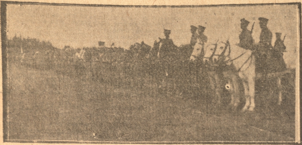
UNA PARTE DE LAS TROPAS FORMADAS EN LA ELIPSE DEL CLUB HIPICO