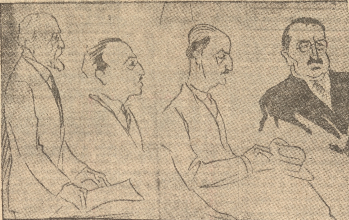
APUNTES DE NUESTRO DIBUJANTE MAGNO DURANTE LA ASAMBLEA DE PROCLAMACION DE DON GONZALO URREJOLA, EFECTUADA ANTEAYER EN EL TEATRO CONCEPCION

Mientras más cerca estamos de la fecha en que se llevará a efecto la lucha electoral por la senaduría de Concepción, Bio Bio y Nuble, mayor es el entusiasmo demostrado por los partícipes de esta popular candidatura, que se manifiesta por el continuo ir o venir de numerosas personas que estampan su firma de adhesión a su candidato.