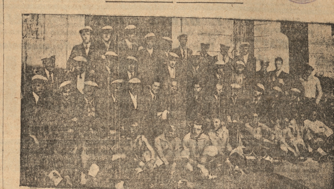
LA DELEGACION DEPORTIVA DE LA ESCUELA DE ARTES Y OFICIOS DE SANTIAGO. POSA PARA "LA PATRIA"

En la mañana de ayer arribaron a esta ciudad los alumnos de la Escuela de Artes y Oficios de Santiago que vienen en gira deportiva por el sur del país. Anoche hicieron su presentación en basketball información que damos en esta misma página.