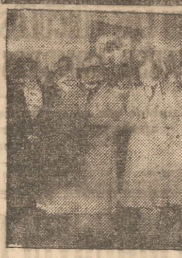
LA ROMERIA AL SALIR DEL CLUB GIMNASTICO ALEMAN

lonia Alemana de nuestra ciudad realiza todos los años a la Torre de Bismarck. — A las 21.30 horas partió la columna desde el local del Club Atlético Alemán, en la calle de Castellón, formando en ella alrededor de quinientas personas. La banda del Regimiento "Chacabuco",