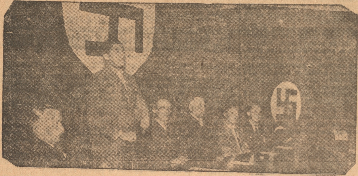
DURANTE LA CONFERENCIA DE LA MESA QUE PRESIDIA

los que tienen prohibición absoluta de inmigrarse en la política de los países donde residen. Si alguno de ellos llega a tomar parte activa en estas actividades queda, de hecho, separado del Partido Socialista. LA CONFERENCIA DE ANOCHE El señor Schmulz dió anoche una conferencia en el Club