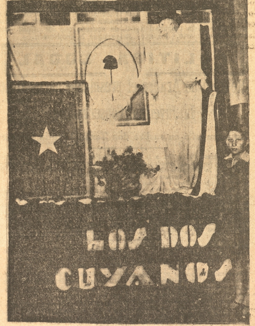
Hermosa vitrina que presentó la Exposición Argentina los Dos Cuyanos