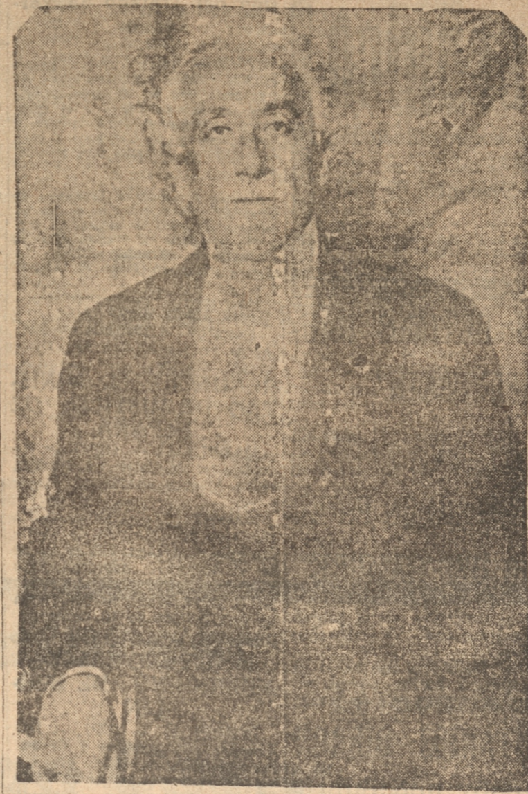
Excmo. señor Niceto Alcalá Zamora, Presidente de la República Española.

España celebra en esta fecha el tercer año de la instauración de la República, importante hecho político que se produjo con la caída de la monarquía, después de la manifestación de poderío que dieron las fuerzas republicanas en las elecciones del 12 de abril. Tres años de vida republicana han permitido a la nación hispana poner orden en la marcha de sus instituciones, y cerrar el paréntesis de inquietudes que, forzosamente, debía abrir en ese país un cambio absoluto en su régimen de Gobierno. Han cesado de manifestarse los enconos que se advirtieron en el primer año de vida de la nueva República y otra vez está marchando esa nación, con paso firme, por los senderos del progreso que la llevarán a destinos mejores, dignos de las tradiciones de ese pueblo y del legado de grandeza y de hidalguía de que es depositaria toda España. En el aspecto político España no ha podido sustraerse a fenómenos que se han advertido en los distintos países del mundo. Ha sufrido ruidos quebrantos internos, pero por encima de todo se han impuesto el patriotismo y el espíritu de la República.