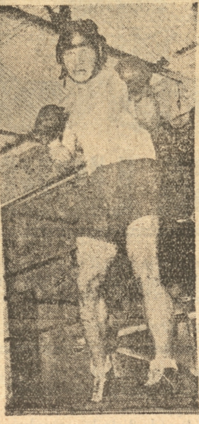
ARTURO GODOY Es uno de los ases del box mundial del momento

Todos los cuadros locales de Nueva York, como también la comisión atlética de Nueva York y la Asociación Nacional de Boxeo, preparan a fines de año un ranking, en el que clasifican del uno al diez los boxeadores de cada categoría. En las clasificaciones del año que termina ha figurado el campeón de peso pesado de Sud América Arturo Godoy, habiendo sido mencionado en el séptimo lugar de la lista de la Asociación Nacional de Box de los Estados Unidos. Julio García, el cronista benéfico de "La Prensa" de Nueva York ha calido en defensa de nuestro compatriota, y pide para el chileno el tercer lugar en el ranking de los peso pesados.