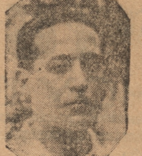
PEREIRA, del Cochrane

presenta el match y lo numerosa que son tanto la barra de los rojos como la de los verdes se hace necesario que impere hoy en la cancha la más absoluta cultura. Los honores de Español y de Cochrane, por la tanta de ser formados a base de gente culta, no deben, esta tarde, dar rienda suelta al pastoreo a fin de que el partido tenga un desarrollo normal y correcto. Los equipos están bien formados. A pesar de que en cada equipo faltarán uno o dos hombres los equipos formados para hoy deben hacer un buen match. Figuran en cada team gente de calidad y varios seleccionados locales. La chance es por pareja para cada team y, como hemos dicho más arriba el resultado del cotejo se hace difícil vaticinarlo antes de su realización. Eso sí que los partidos de cada team, desde ya se atribuyen la victoria lo que hace ver en forma nitida lo que tienen en los hombres que esta tarde defenderán los respectivos colores de Cochrane y Español. Como formarán los teams Los cuadros que actuarán hoy por la dirección del señor Luis D. Maia serán los siguientes: Lord Cochrane (verdes) Astora Grossmann Saavedra Arriagada Henríquez Pereira Pancho Flores Reinaldo Madariaga — Rojas Grandón Martín Martínez Garrido Urrutia Vargas Pedreros Acevedo Deportivo Español (rojos) El calendario oficial