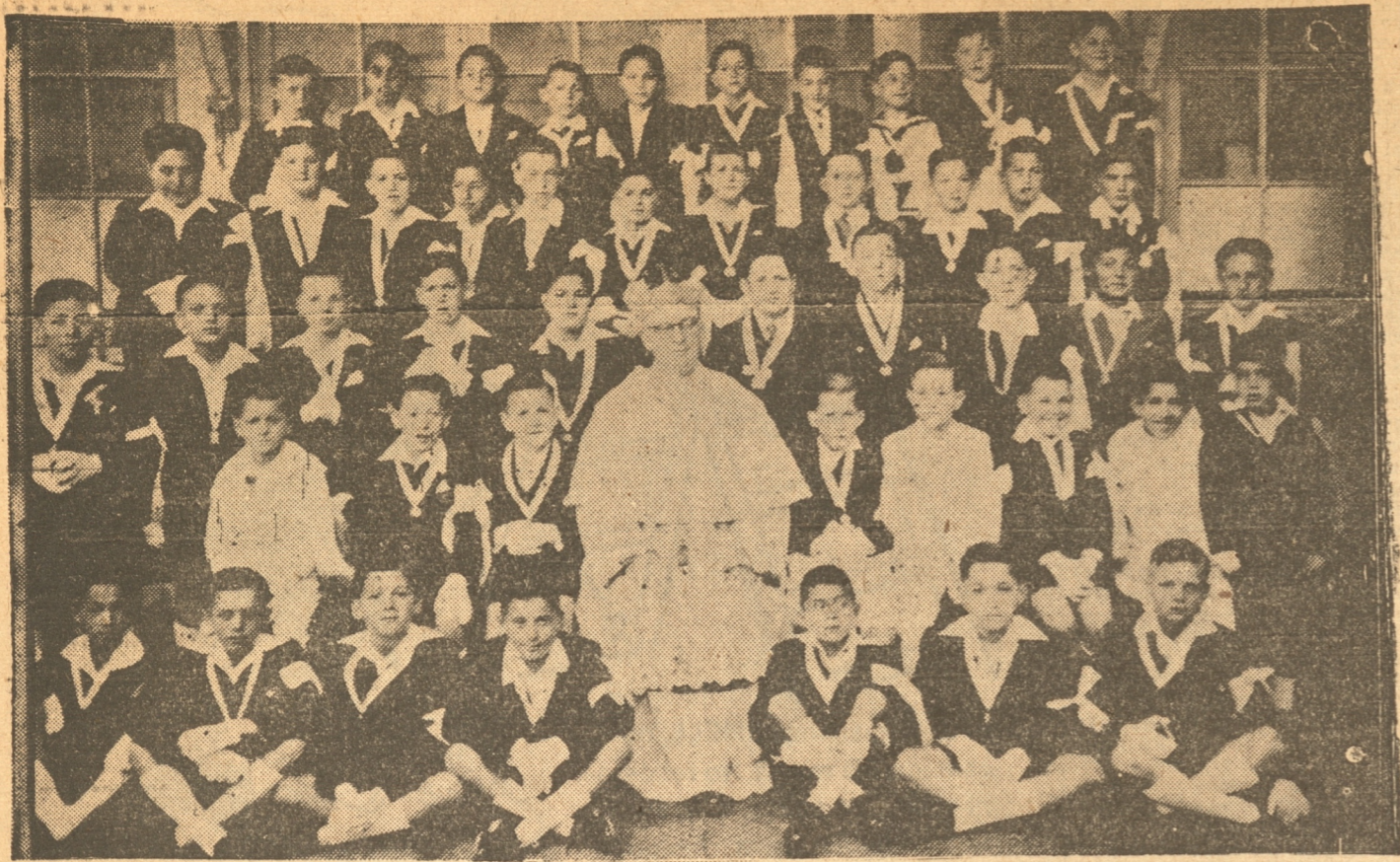
El Excmo. Obispo de Poda-acompañado de los niños que, de sus manos, en el día S. S. Corazonos, de nuestra...