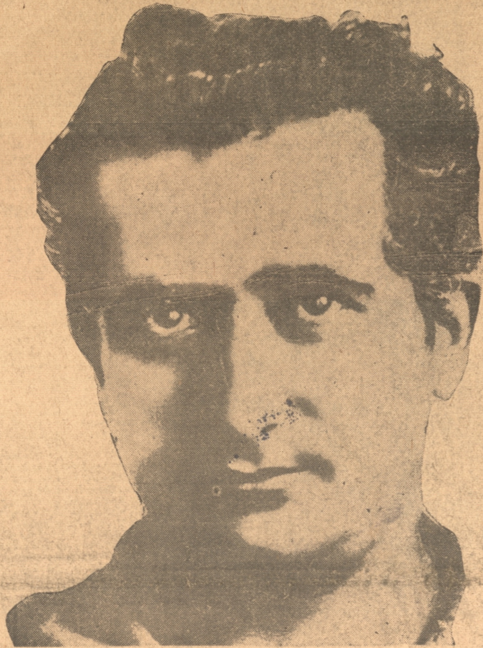
EL AVIADOR ESPAÑOL RAMON FRANCO, QUE MURIO VICTIMA DE UN ACCIDENTE ACAECIDO CERCA DE LAS ISLAS BALEARES. SU NOMBRE SE HIZO FAMOSO EN EL MUNDO A RAIZ DEL RAID PALOS - BUENOS AIRES EN EL "PLUS ULTRA", REALIZADO A PRINCIPIOS DEL AÑO 1926. REALIZO DESPUES OTRAS PROEZAS AEREAS QUE CONFIRMARON SU FAMA. TUVO TAMBIEN, EN SU PATRIA, ACTUACION EN POLITICA. ERA EL MENOR DE LOS HERMANOS DEL GENERALISIMO DE LOS EJERCITOS ESPAÑOLES NACIONALES.

EL HIDROAVION QUE PILOTEABA CAYO AL MAR EN MEDIO DE UNA TORMENTA — SU CADAVER FUE ENCONTRADO SOBRE LOS RESTOS DE LA MAQUINA. — TODOS LOS OTROS tripulantes MURIERON