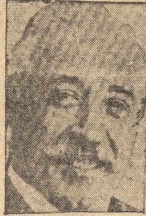
Excmo. don Niceto Alcalá Zamora, primer Presidente de la República Española

LA SESION EN LAS CORTES MADRID, 10.— (UP).— La sesión de las Cortes Constituyentes empezó a las 16.30 horas. Las sesiones estaban completamente repletas de público. La votación comenzó a las 17.40 horas. Cada diputado co-