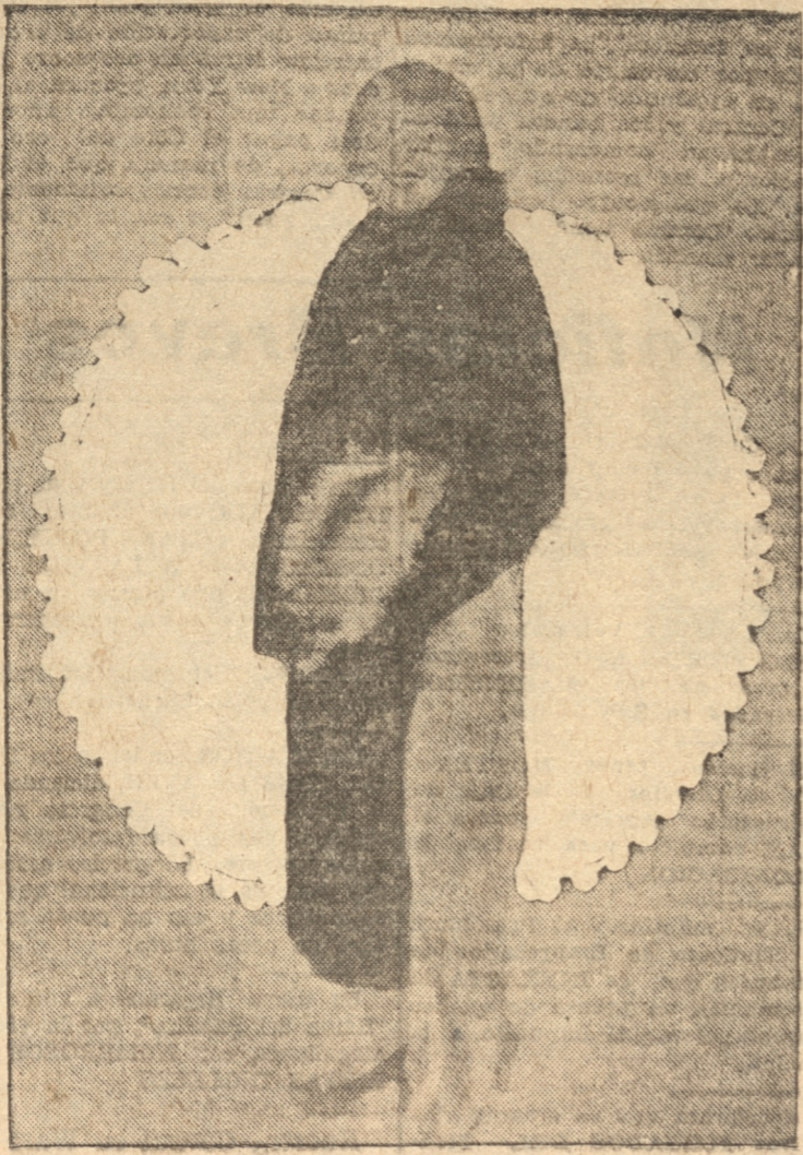
EL ABRIGO DE PIELS Y EL ZORRO QUE OBSEQUIA "LA PATRIA"

Tabla: elección de oficiales 1932 y asuntos varios.