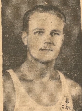
SAIP Del Alemán