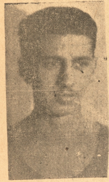
BARTLET Del Universitario

Doble programación y mucho atractivo.— Los mejores equipos de Concepción y Talcahuano se cotejan.— Buenos premios.— Se espera un gran público para estos encuentros