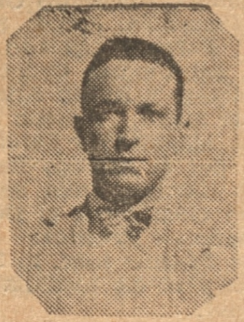
F. CODDOU DTL COCHRANE

Los "Juveniles" del Audax Deportivo de Schwager y Arturo Cousiño de la localidad en el preliminar