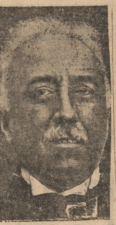
Excmo. señor NICETO ALCALA ZAMORA, Presidente de la República Española

La República Española conmemora en el día de hoy el cuarto aniversario de su proclamación.