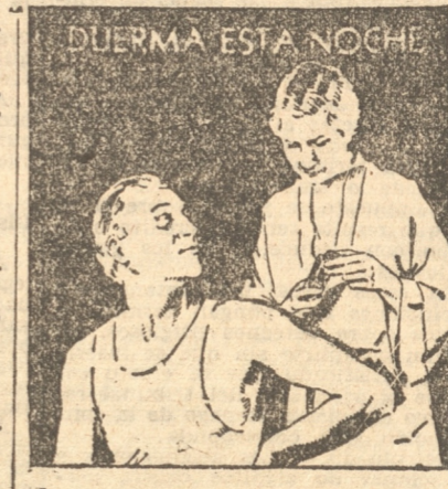
El Marido: suerte que tenemos Sloan en casa. La Esposa: sí, ahora se te parará el dolor y podrás descansar bien toda la noche.