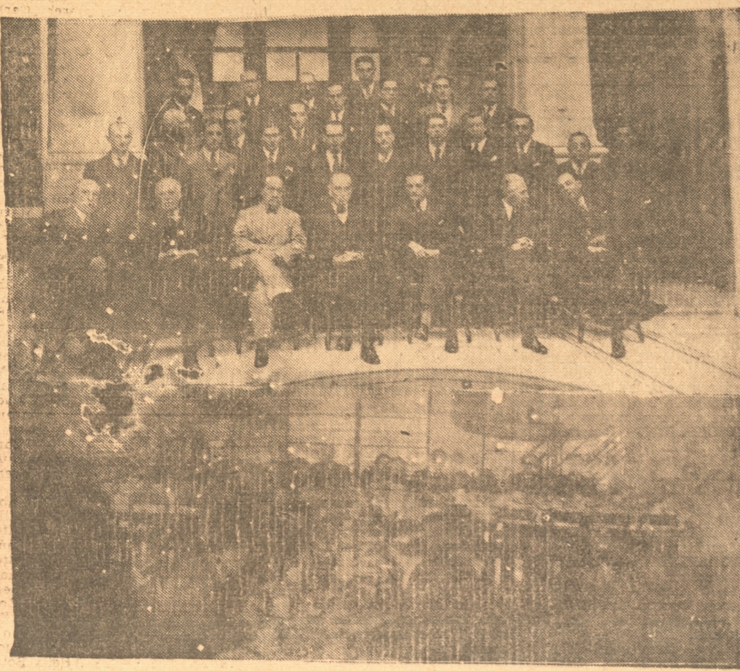
Asistentes al cocktail, en el Club Concepción, y, aspecto de la manifestación en la Escuela de Leves, en honor de los estudiantes ecuatorianos que nos visitan.

Cocktail en el Club Concepción. — Programa de hoy. — La partida