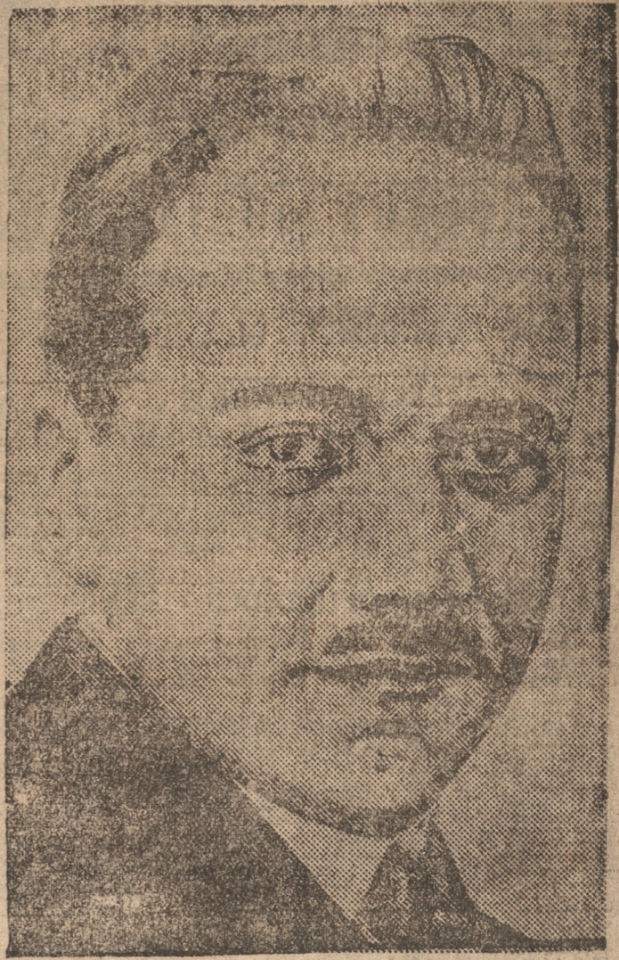
Dollfuss el Premier de Austria que está logrando imponerse sobre los revolucionarios.

VIENA. 15.— (UP).— A las nueve horas, diez mil schutzbundesistas se rindieron en Viena.