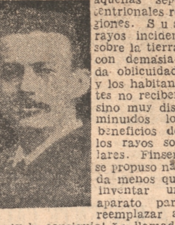
Niels Ryberg Finsen nació en Dinamarca en 1860. Nadie ignora que el sol es muy útil en aquellas septentrionales regiones.

Niels Ryberg Finsen nació en Dinamarca en 1860. Nadie ignora que el sol es muy útil en aquellas septentrionales regiones. Sus rayos inciden sobre la tierra con demasiada oblicuidad, y los habitantes no reciben sino muy disminuidos los beneficios de los rayos solares. Finsen se propuso nada menos que inventar un aparato para reemplazar al sol, y lo consiguió! La llamada "luz de Finsen", en homenaje a él, está formada principalmente por rayos violeta y ultravioleta, obtenidos merced al paso de la luz proveniente de un arco voltaico a través de una solución de sulfato de cobalto amoniacal. Esta solución absorbe los rayos amarillos, rojos y ultrarrojos, de manera que sólo pasan los violeta y ultravioleta. Por su genial descubrimiento, a Finsen le fué discernido el Premio Nobel en 1903, mientras era director del Instituto Real de Copenhague. Murió en septiembre de 1904. Sus esfuerzos en procura de un sustituto de la luz solar hicieron que un escritor contemporáneo, Paul de Kruif, le apodara "el cazador de luz".