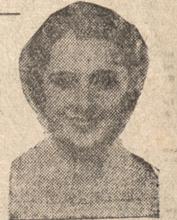
Suzu Pitts, Lucien Littlefield y Richard Alden secundan a Bárbara Stanwyck en el estreno de hoy en el Rialto. "Amor mancillado" es una producción toda hablada en inglés, aprobada sólo para mayores.

Bárbara Stanwyck, actriz a quien no veíamos hace tiempo, alcanza su mayor triunfo cinematográfico en "Amor mancillado", en la que desempeña el rol protagonista. Regis Toomey,