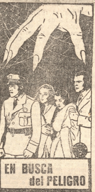
EN BUSCA del PELIGRO

TOTAL del consumo nacional . . . . . 4.670.000. La cosecha de 1932 fué, según las estadísticas . . . . . 5.800.000.