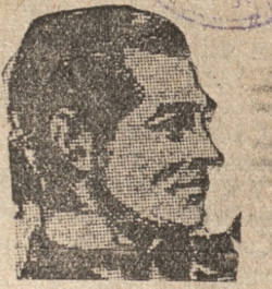
"Poseida", es una película toda hablada en inglés, aprobada por la censura sólo para mayores.

Argumento moderno, lleno de movimiento, nos presenta en su desarrollo la historia de dos jóvenes que luchan desesperadamente por llegar a la consumación de su amor. Hay en esta producción sentimiento, drama y acción que llega a los espectadores.