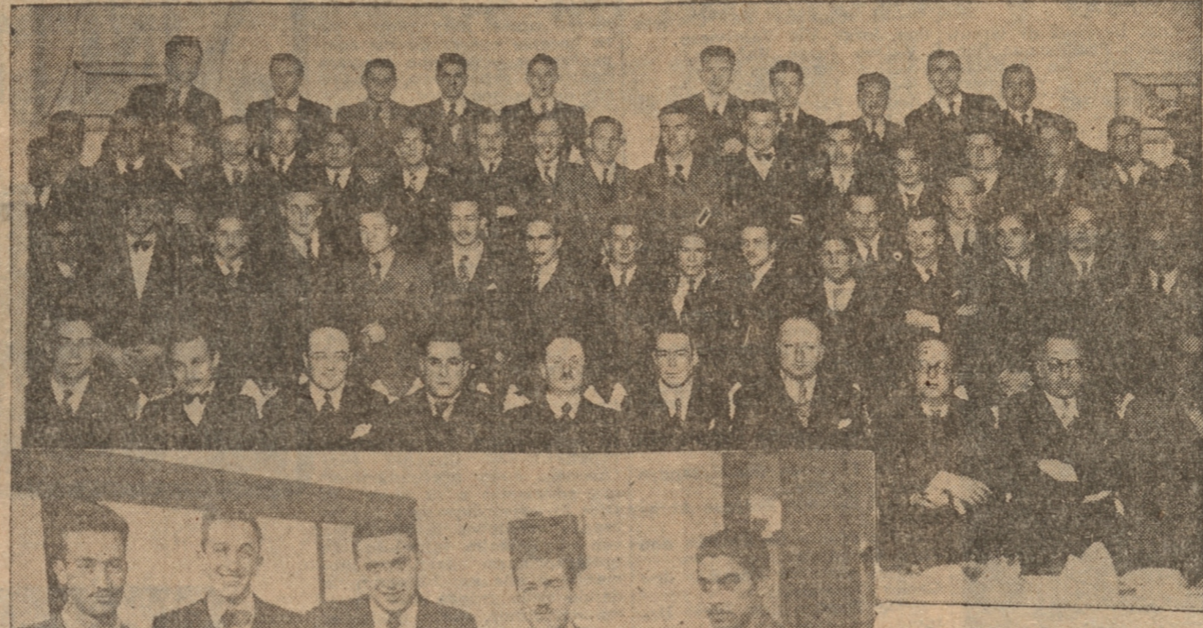
Asistentes al banquete de los Ingenieros Químicos verificado antenoche. — Grupo del directorio del Centro de Ingeniería Química.

La celebración de la Semana del Ingeniero Químico terminó ayer con el gran baile social de anoche. Este baile como lo habíamos anunciado fué un verdadero éxito de los alumnos de Ingeniería, que durante toda las festividades de su Semana han hecho derecho de buen gusto artístico y alegría.