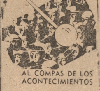
AL COMPAS DE LOS ACONTECIMIENTOS