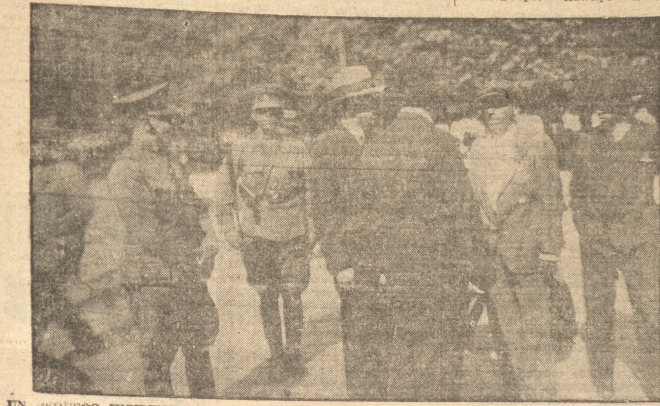
UN PEQUEÑO INCIDENTE SATISFACTORIAMENTE SOLUCIONADO POR LOS CARABINEROS

Departamento de Búlnes Comuna de Búlnes: Urrejola