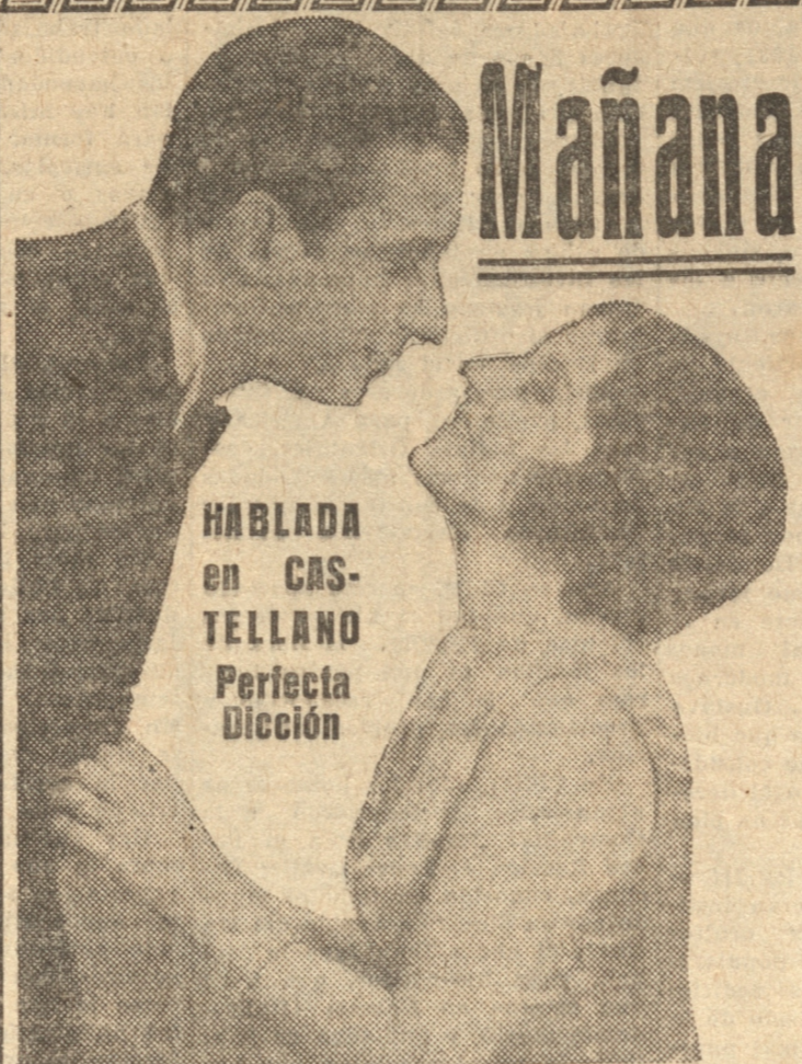
HABLADA en CASTELLANO Perfecta Dicción