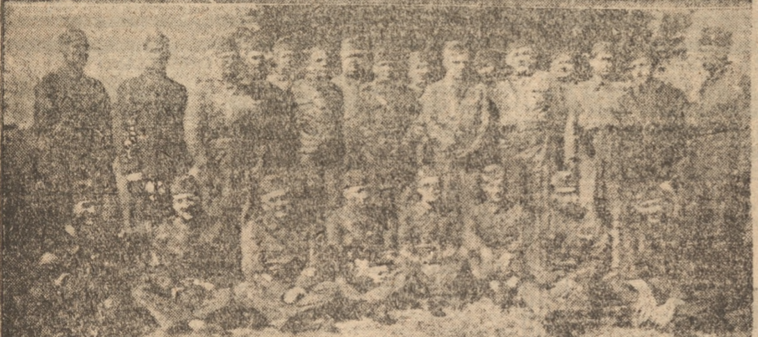
EL ESTADO MAYOR PROVINCIAL Y JEFES DE LAS UNIDADES DE LA PROVINCIA CON ALGUNOS OFICIALES DE CONCEPCION

tr en su sector; mientras or ganizo el grueso y recibió re fuerzos para seguir hacia Pen co y Tomé con el fin de ha cer reembarcar a los Rojos. A sus órdenes tendrá Una Batería de Campana. NOTICIA Por patrulla Oficial he te nido conocimiento que tropas Rojas más o menos Un Bata llon están organizadas defensi vamente en las alturas Lo Ca rrasco; al Noroeste de La guna Los Mendez.