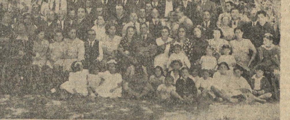
GRUPO DE ASISTENTES AL PASEO DE LOS CARTEROS

PASEO CAMPESTRE A LA MOCHITA Y CAMPEONATO INTERNO DE RAYUELA Y CARRERAS DE 100 METROS