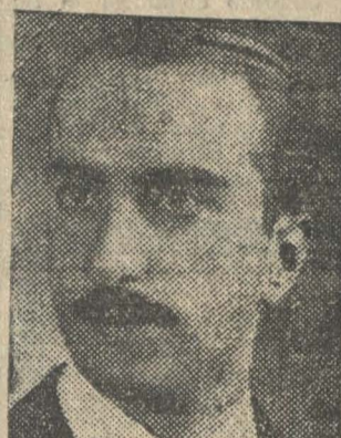
Don Manuel Garretón W., Presidente de la Falange Nacional

Aprovechando la presencia en Yumbel del Diputado y Presidente de la Falange Nacional don Manuel Garretón Walker, nos hemos acercado a él para solicitarle algunas declaraciones sobre algunos puntos que estimamos de interés dentro de los acontecimientos de la política actual.