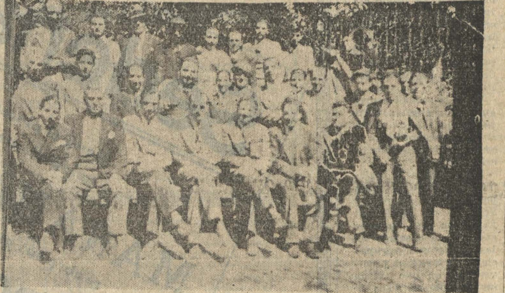
Un gran número de falangistas y simpatizantes concurren al almuerzo que la Falange de Yumbel ofreció a las delegaciones. La presente fotografía presenta a un grupo de ellos con el Presidente Nacional, Manuel Garretón y otros dirigentes

Como estaba anunciado el domingo pasado, en la quinta "La Mochita", se llevó a efecto el paseo campestre que tenían organizado los carteros de esta ciudad, en celebración del "Día del Cartero", y a cuyo paseo concurrió gran número de adherentes y delegaciones de Lota, Tomé y Talcahuano.