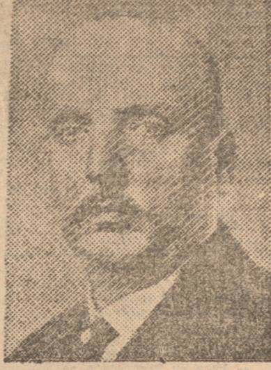
Mikias, Presidente de Austria

de ese punto hasta Concepción. En este viaje estudiará la posibilidad de declarar a Magallanes puerto limpio de primera clase. Además visitará detalladamente los servicios sanitarios de Concepción y demás ciudades que se encuentran ubicadas dentro de esa provincia.