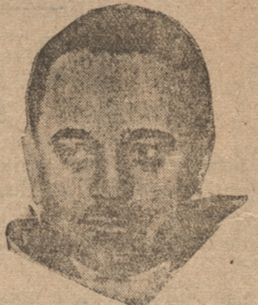
Dollfus, cuya energía será puesta a prueba en estos días de inquietud en Austria

VIENA, 12.— (UP).— En esta ciudad corren algunos trenes. A medio día había algunos obreros electorales todavía en sus puestos.