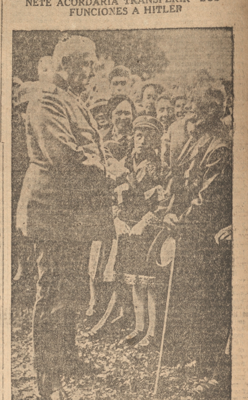
EL MARISCAL PAUL VON HINDENBURG conversando con algunas personas que lo visitaron en su cumpleaños

AYER SE TEMIA QUE NO PASARA EL DIA. — HASTA LA NOCHE SU ESTADO NO HABIA EMPEORADO. — SE DICE QUE, SI MURIERA EL PRESIDENTE, EL GABINETE ACORDARIA TRANSFERIR SUS FUNCIONES A HITLER