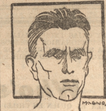
ROA, atleta internacional que correrá hoy

Controles El Rangers ha designado también el número necesario de controles para evitar toda clase de dificultades en su desarrollo, habiendo designado a las siguientes personas para este objeto: en los puntos que se indican.