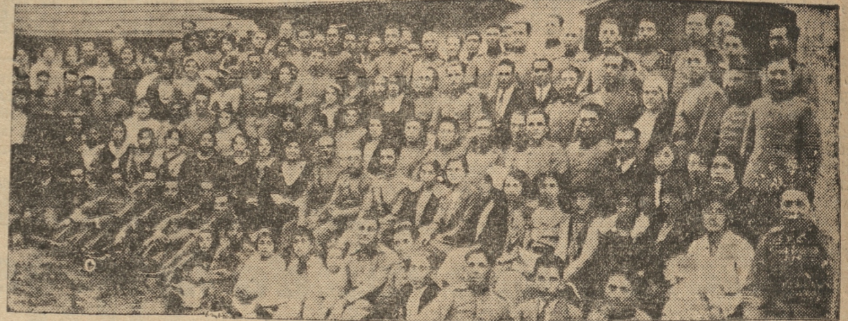
GRUPO GENERAL DE LOS ASISTENTES A LA RECEPCION