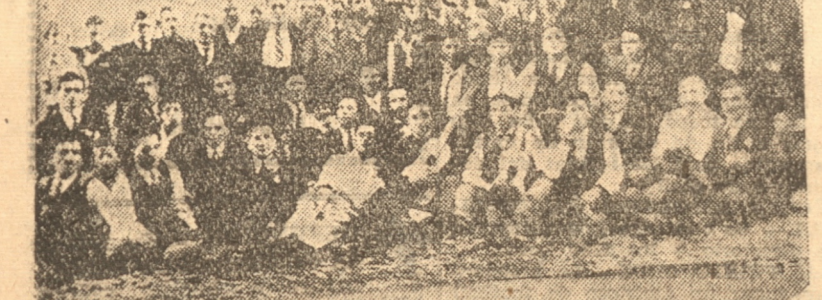
Grupo de asistentes al paseo campestre del Centro Concepción de la Unión Nacional, a Lo Galindo

Sindicato Profesional de Suplementarios. — Citase para hoy a las 19 horas a reunión general.