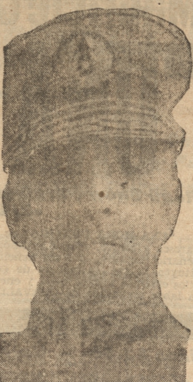
GENERAL BLANCHE, Presidente Provisional

El general Wisnola, en respuesta, manifestó su adhesión a la causa del señor Benítez.