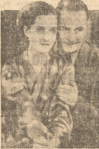
NORMA SHEARER y ROBERT MONTGOMERY en "PRIVATE LIVES"