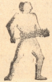
EXTIRMINA TODOS LOS INSECTOS

NUNCA molestarán las moscas en su casa si pulveriza las habitaciones con el super-insecticida Shell-Tox, utilizando el moderno pulverizador Shell-Tox.