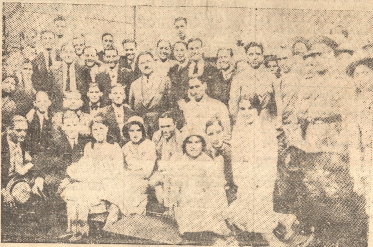
LA DELEGACION DE INDEPENDIENTE POSA PARA "LA PATRIA". — VARIAS MUCHACHAS CHILENAS QUISIERON ACOMPAÑAR A LOS ARGENTINOS EN ESTA FOTO. GRAFIA DE RECUERDO

Sin embargo tenemos un día para descansar y creo que obtendremos los fines perseguidos y que ya les he señalado."