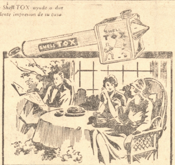
Deje que SHELL TOX ayude a dar una excelente impresión de su casa

Se informa que no se llevará adelante la proyectada traslación de la Escuela Vocacional de los Andes a Valparaíso.