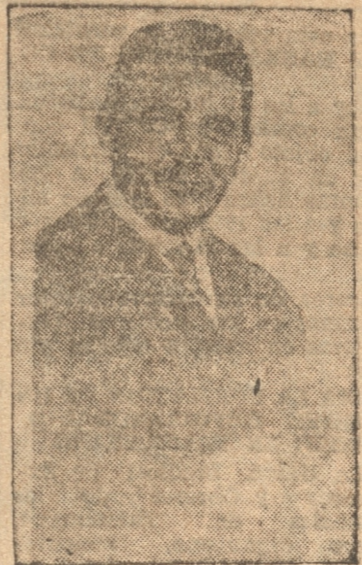
El jefe del Gabinete francés, M. Edouard Herriot.

ni transacciones; simplemente hemos comparado nuestros puntos de vista y descubrimos que nuestros pensamientos corren en la misma dirección. Nuestros Gobiernos han decidido hacer que la conferencia de Lausanne sea verdaderamente eficaz".