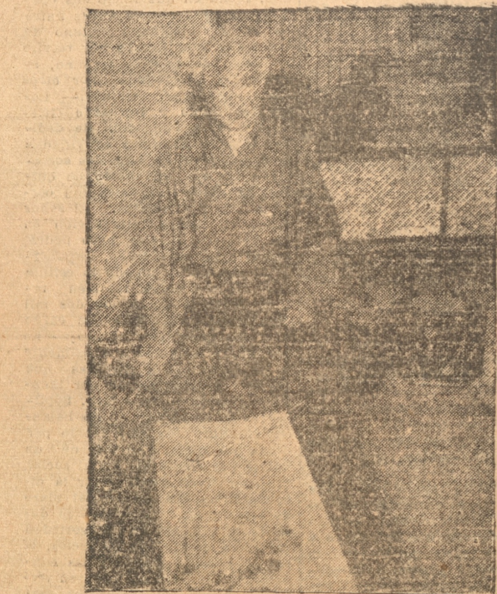
Mientras los pintores occidentales ejecutan sus obras en caballete vertical, los artistas japoneses las realizan tendiendo la tela en el suelo.

dad y no hay duda que el año de la mayoría de los japoneses para adoptar costumbres occidentales ha sido lugar a más de una escena ridícula y festiva. Cuando se inauguró la línea férrea entre Tokio y Yokohama, el emperador asistió en persona a la ceremonia de la inauguración. Para no desentonar con la ola de "européismo" que está asediando al país entero por aquella fecha, el emperador creyó oportuno trasladarse desde el palacio hasta la estación en un carruaje que lo había sido obsequiado por el ministro inglés, en lugar de usar su habitual palanquín. Era la primera