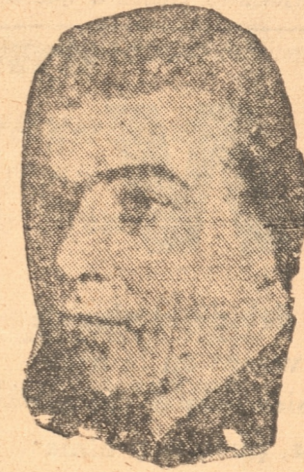
Don ALBERTO EDWARDS

Falleció en esta capital el ex-Ministro de Estado y ex-parlamentario y escritor don Alberto Edwards Vives. Sirvió la Dirección General de Estadística, cargo que debió dejar al caer la Dictadura de general Ibañez. Fué Ministro de Hacienda, en 1914, en 1915 y en 1927. También tuvo cargos ministeriales en el Gobierno de facto, entre otros el de Educación Pública. Actuó en el Parlamento como representante de Valparaíso en 1909 y tuvo larga actuación en el periodismo y en el mundo de las letras. Había nacido en 1874.