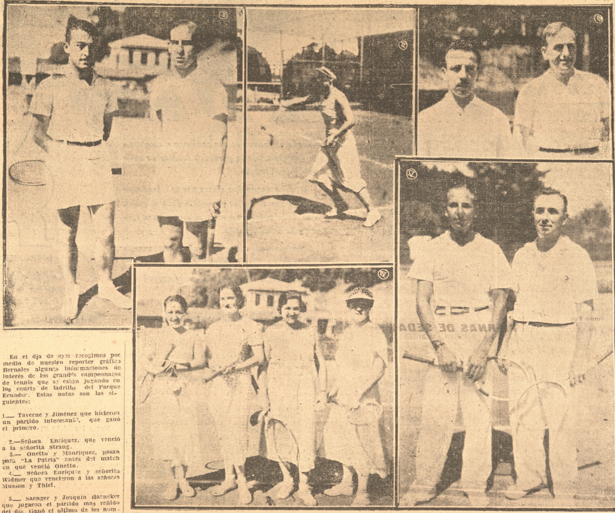
En el día de ayer recogimos por medio de nuestro reporter gráfico Bernalde algunas informaciones de interés de los grandes campeonatos de tennis que se están jugando en los courts de ladrillo del Parque Ecuador. Estas notas son las siguientes: